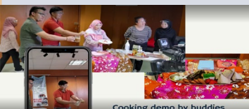
Cooking demo by buddies