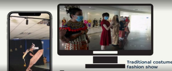
Traditional costume fashion show